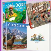
One of four board games