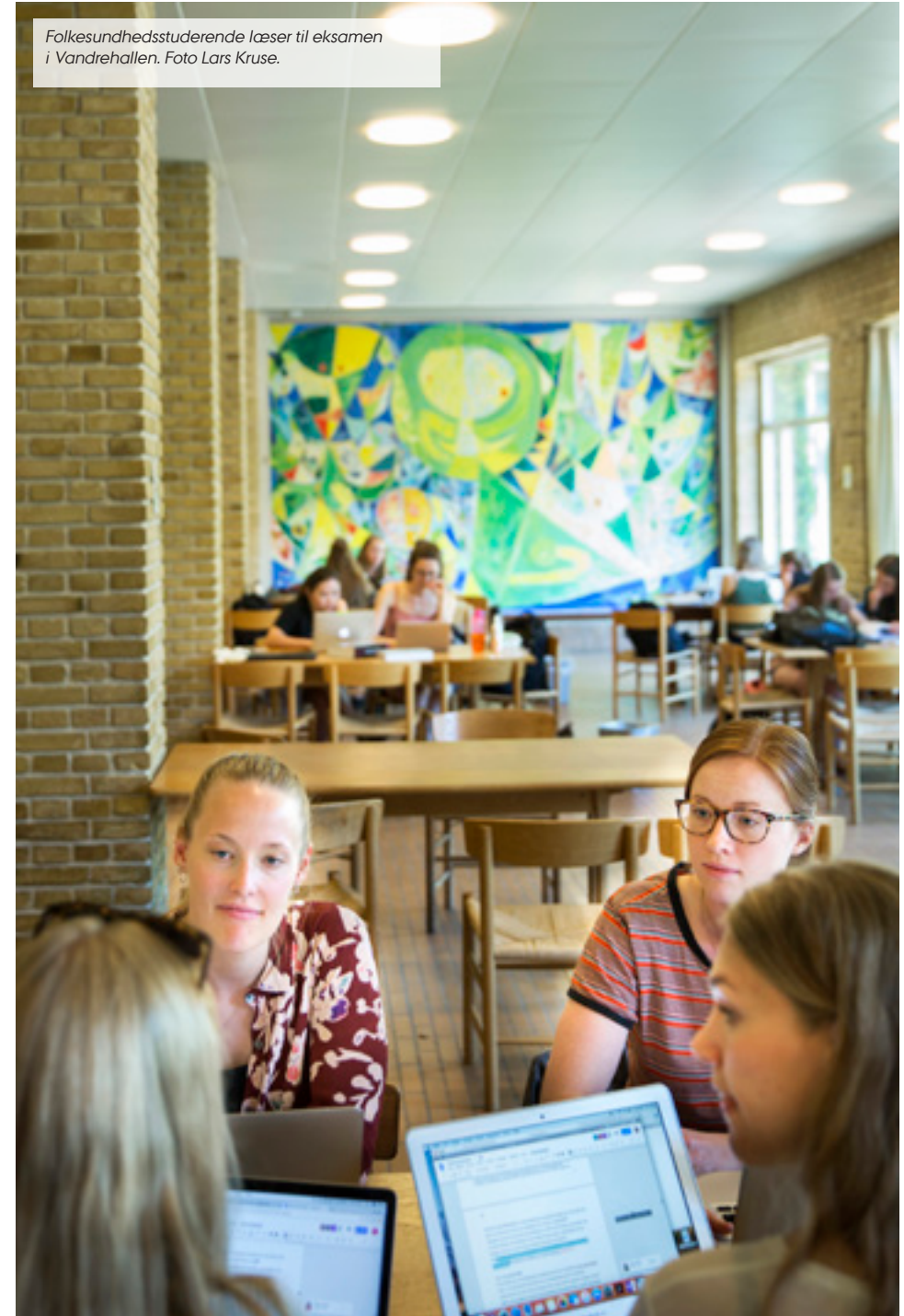
Folkesundhedsstuderende læser til eksamen i Vandrehallen.

AU er et campusuniversitet, hvis fysiske rammer skal bidrage til et stimulerende studie- og læringsmiljø. Alle studerende skal have et bredt udvalg af muligheder for at deltage i faglige og sociale fællesskaber, hvor der er fokus på engagement, rummelighed og seriøsitet. Sammen med de faglige miljøer og uddannelsesledelsen skal studerende bidrage til at skabe et inkluderende studiemiljø, hvor respekt og ordentlighed støtter alle i at sige fra over for chikane, mobning, voldelig adfærd og diskrimination.