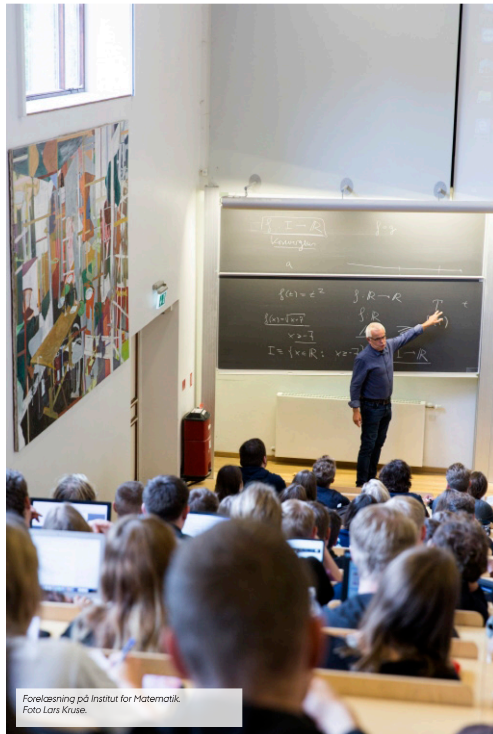
Forelæsning på Institut for Matematik.

Undervisningen skal understøtte læring gennem varierede og aktiverende læreprocesser, som gør det muligt for studerende at tilegne sig fagets viden, færdigheder og kompetencer. De valgte eksamensformer skal sikre, at det lærte afprøves, og at den studerendes præstationer bliver retfærdigt vurderet.