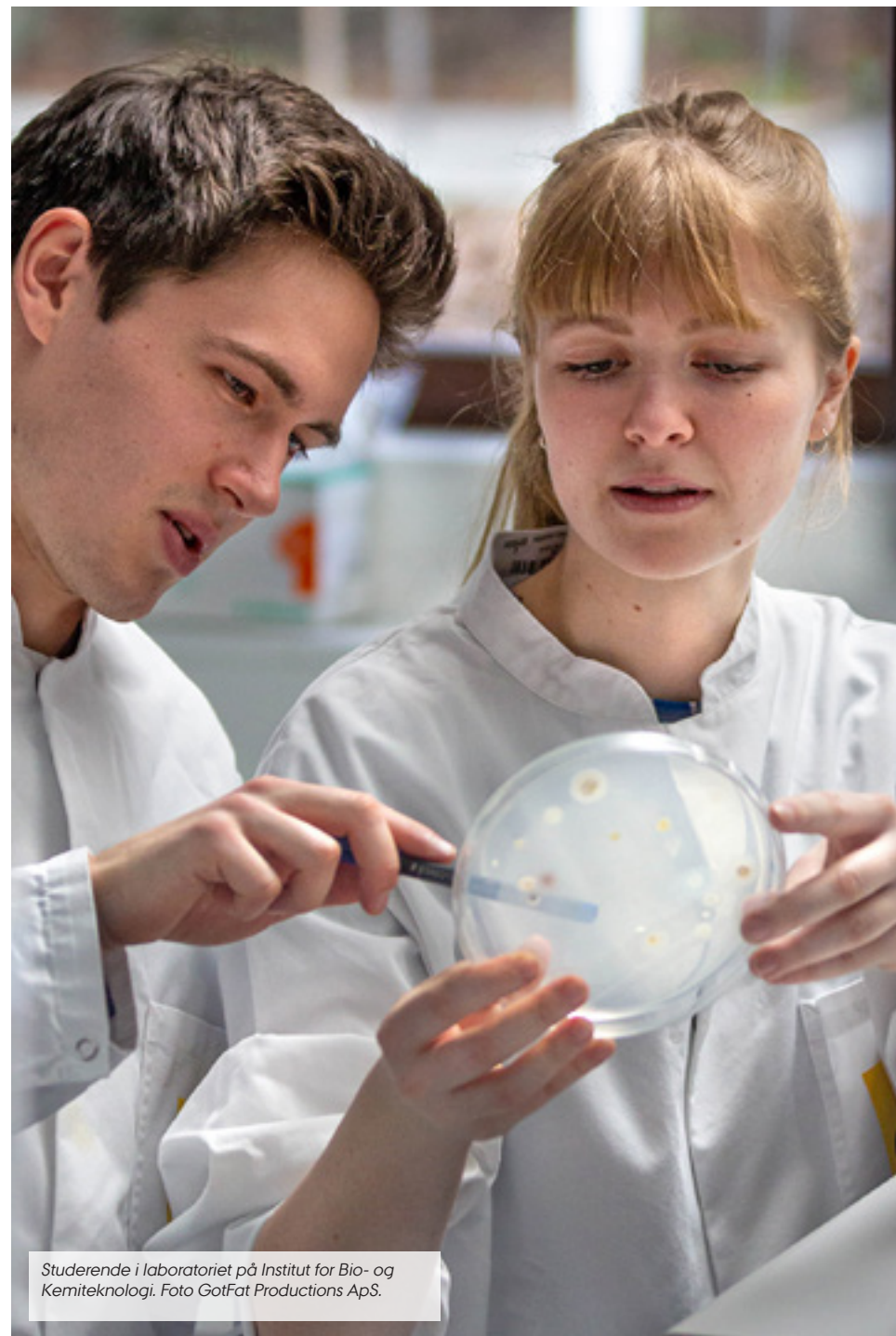
Studerende i laboratoriet på Institut for Bio- og Kemiteknologi.

På AU skal de studerende erfare, at uddannelserne er udviklet og tilrettelagt med inddragelse af relevante aftagerperspektiver. Aftagere skal derfor inddrages i det løbende arbejde med at udvikle kvalitet i AU's uddannelser.